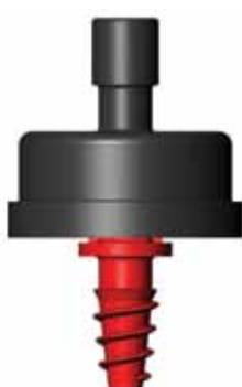
GOUTTEUR POT SORTIE CONIQUE