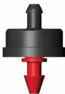
GOUTTEUR BOUTON 3MM SORTIE TÊTE DE VIPÈRE