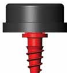
GOUTTEUR POT SORTIE FLAT