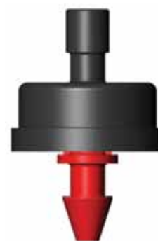
GOUTTEUR BOUTON SORTIE CONIQUE